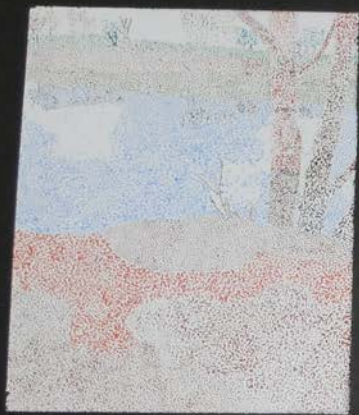
SAMUELE DEI ROSSI L'Albero 2011 olio su tela