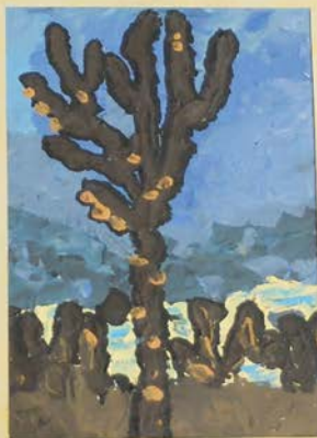
GIULIO FAGGIANI L'Albero 2011 olio su tela